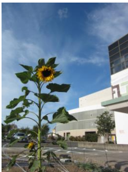
高さ約120cm すこし下向きの謙虚な性格